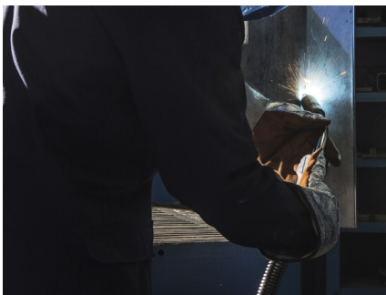
Für alle Schweißpositionen