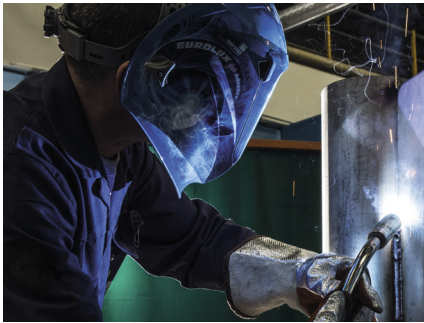
MAG-Schweißen hochlegierter Stähle

ARCAL™ Chrome ist die hochwertige Schutzgaslösung zum MAG-Schweißen hochlegierter Werkstoffe.